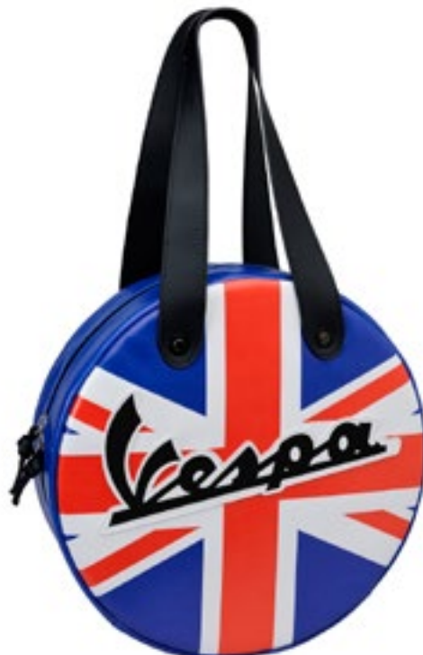
BORSA NAZIONI REGNO UNITO