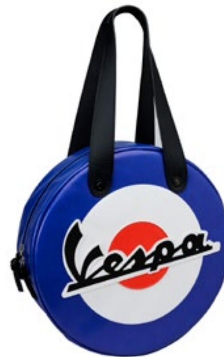
BORSA NAZIONI FRANCIA