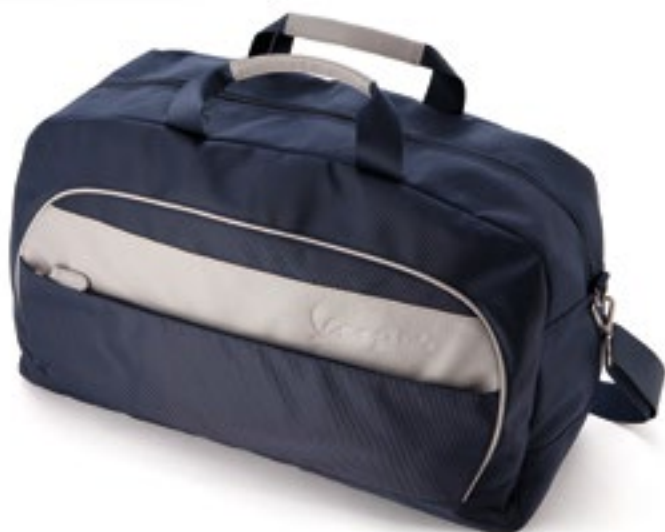
BORSA DA VIAGGIO BLU / GRIGIO