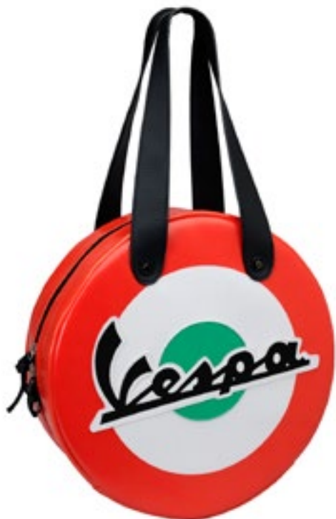
BORSA NAZIONI ITALIA