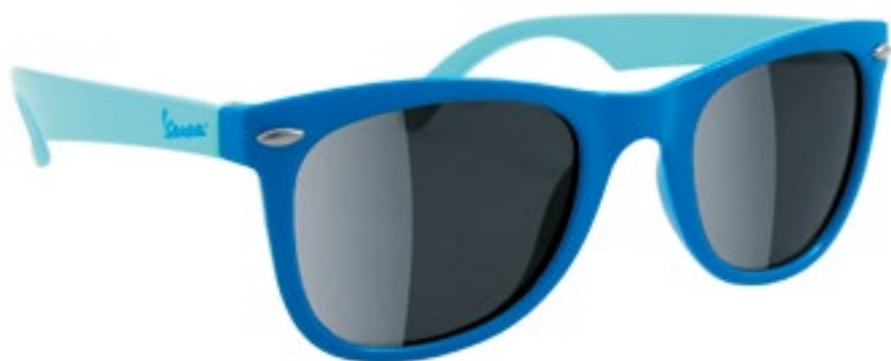
KIDS BOY BLU