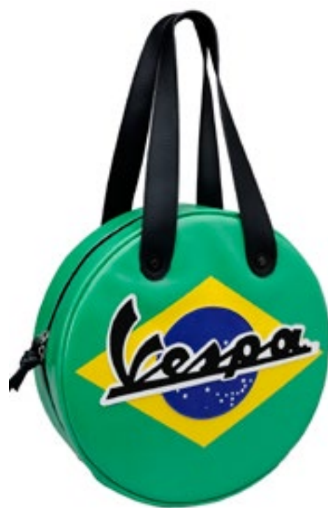
BORSA NAZIONI BRASILE