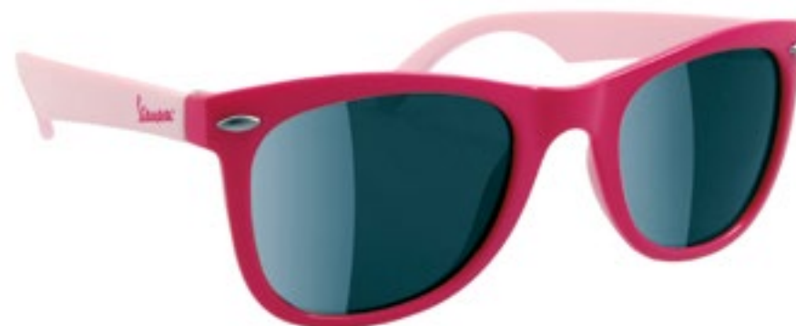
KIDS GIRL PINK