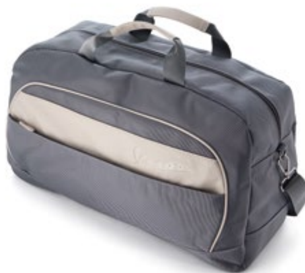
BORSA DA VIAGGIO GRIGIO / AZZURRO