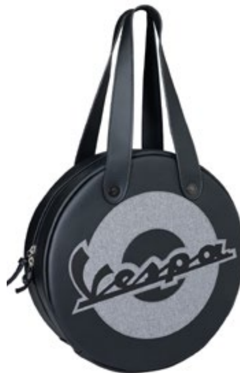
BORSA TONDA NERA