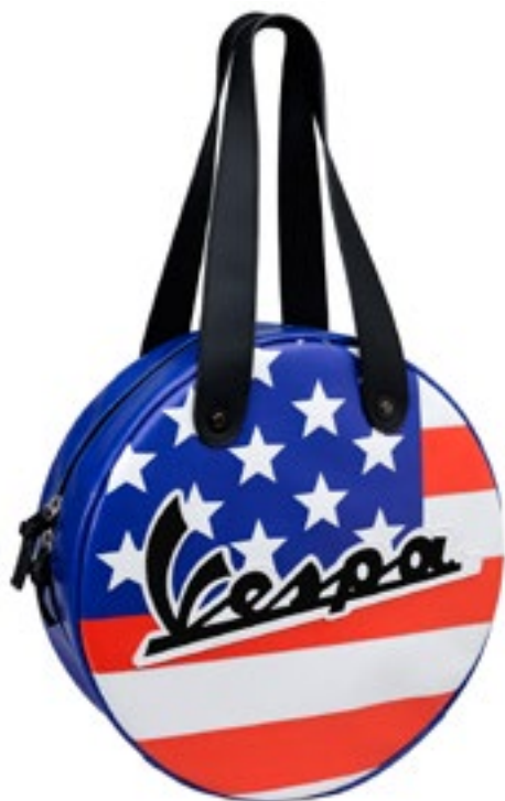
BORSA NAZIONI STATI UNITI