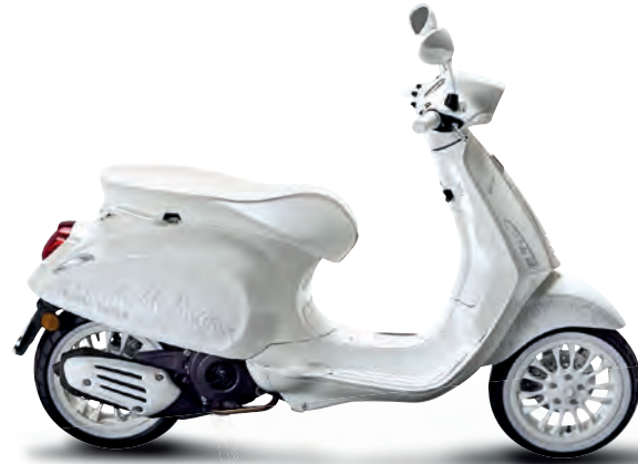
Bianco Justin Bieber x Vespa**