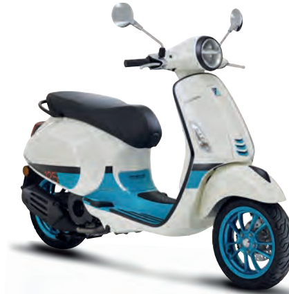
Bianco Color Vibe