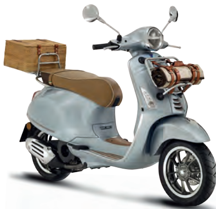
Grigio Pic Nic