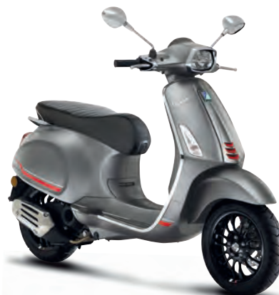
Grigio Travolgente matt