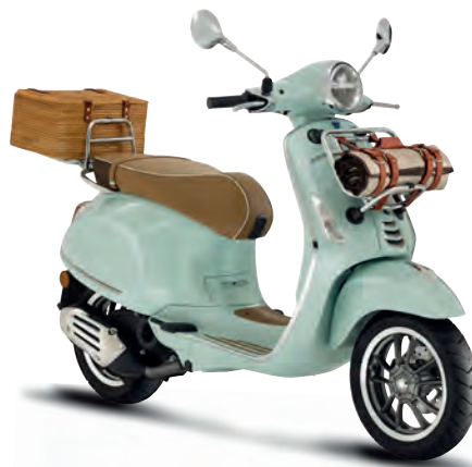
Verde Pic Nic