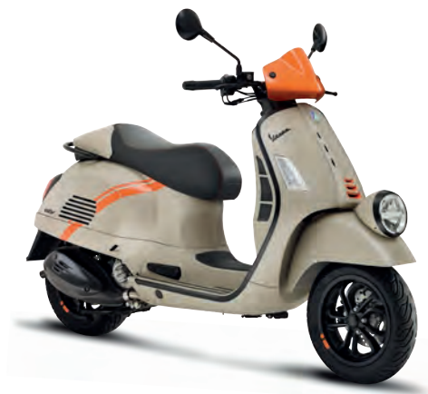
Beige Avvolgente matt*