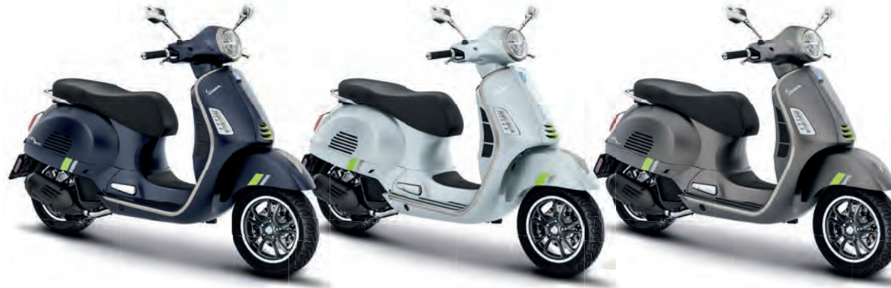
Blu Energico matt