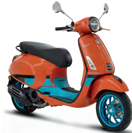
Arancio Color Vibe