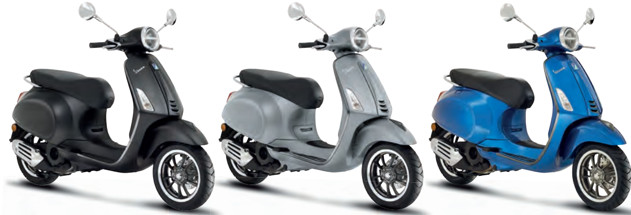
Nero Convinto matt