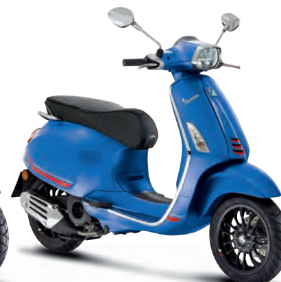
Blu Vivace matt**