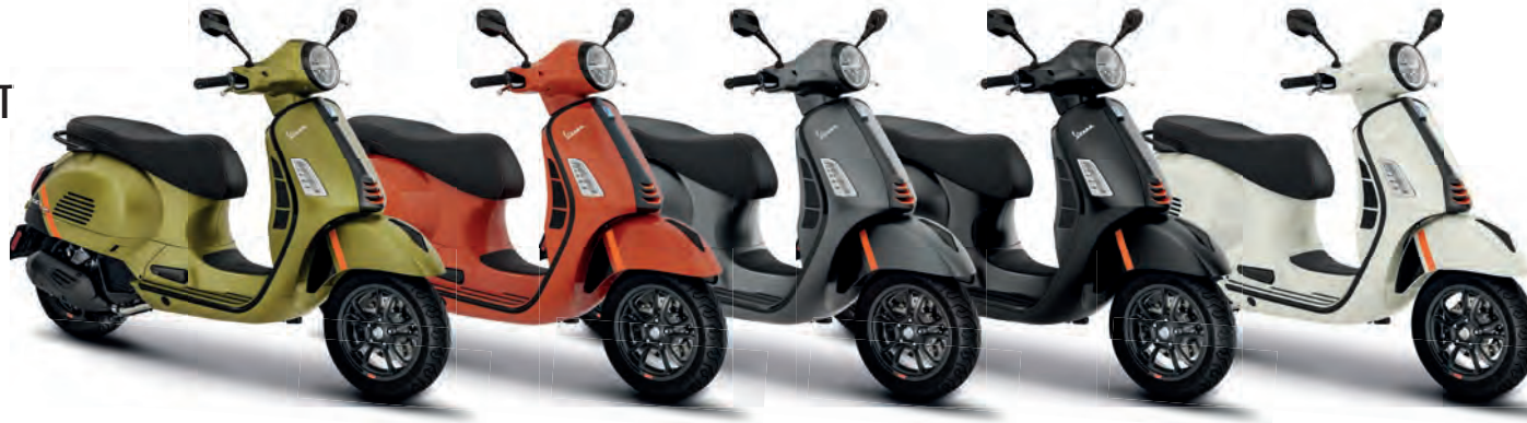
Verde Ambizioso matt