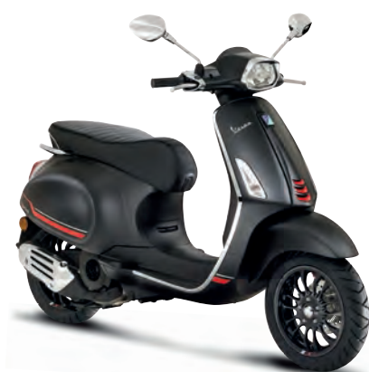
Nero Convinto matt